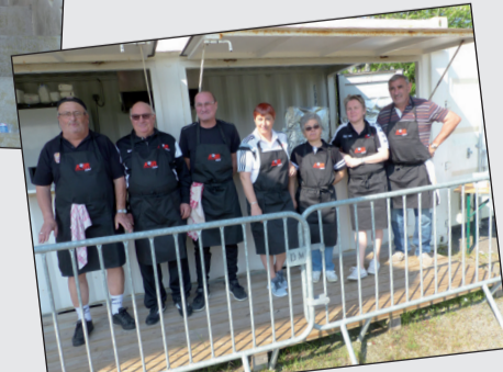
Notre équipe de bénévoles « grillades », réunie pour la 1 ère fois de l'année lors du tournoi du 20 avril.