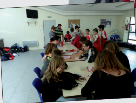
Belle réussite pour les 2 soirées d'échanges de vignettes pour l'album du club.