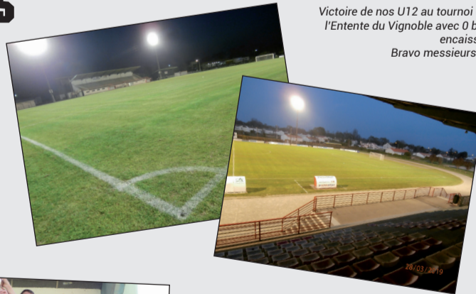
Victoire de nos U12 au tournoi de l'Entente du Vignoble avec 0 but encaissé. Bravo messieurs !!!